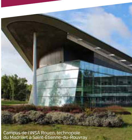
Campus de l'INSA Rouen, technopole du Madrillet à Saint-Étienne-du-Rouvray