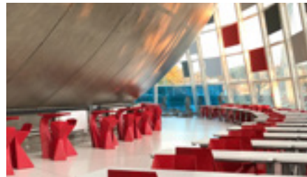
Espaces de convivialité modulables des étudiants