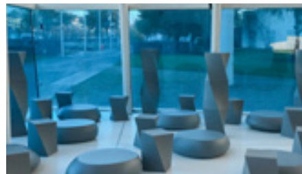
Espaces de convivialité modulables des étudiants